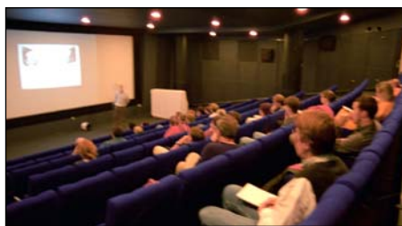
Mit sidste foredrag om tegnefilmens historie under Animani 96 i Filmhuset.