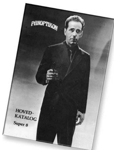
Panoptikons hovedkatalog fra 1980 var filmsamlernes bibel, og det var forbilledet for mit LaserDisc-katalog i 1986.