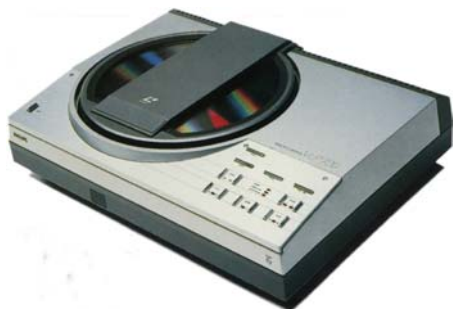
1983: Min første videopladespiller.

En anden og lige så vigtig forskel var billedkvaliteten, der var ca. 70 % bedre end VHS-videokassetterne, og lyden var i stereo. Og man kunne købe indspillede film til rimelige priser. Da systemet kom på markedet i Vesttyskland, fik jeg hjælp af en ven til at skaffe mig en afspiller fra Flensborg, og jeg købte film fra HMV i London. Det var i sommeren 1983.