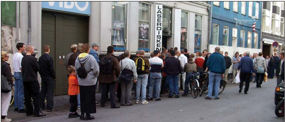
Fødselsdag i Laserdisken i København, 1. oktober 2000

- Jamen, der er jo ikke ret mange, der har det, hørte jeg ofte som argument for at holde sig væk fra LaserDisc, men det prellede af på mig. Min fornøjelse ved at se film på LaserDisc hjemme i min biograf blev hverken større eller mindre af, om andre havde samme fornøjelse. Efterhånden blev vi alligevel nogle stykker.