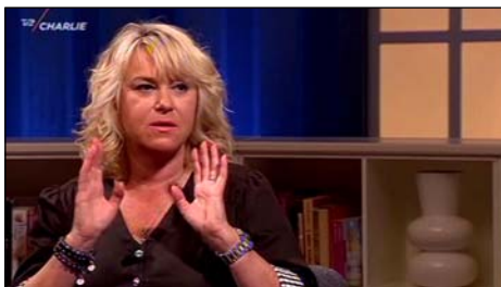
den skjultekorrupsion.dk/video56 Spørg Charlie , 8. maj 2016