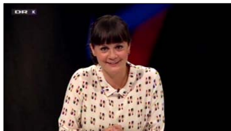
den skjultekorrupsion.dk/video55 Sprogquizen , 6. oktober 2016

I Sverige bruger de også ordet tivoli som et navneord for en forlystelsespark. Den danske komedie Firmaskovturen (1978) fik f.eks. den svenske titel Firmafest på Tivoli , selvom handlingen udspiller sig i Dyrehaven!