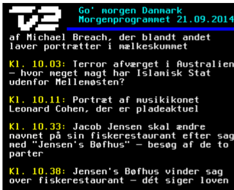
TV2's tekst-tv, 21. september 2014

Da ordet Jensen i sig selv mangler særpræg og ikke gennem indarbejdelse har opnået særpræg for Jensen's Bøfhus A/S' restaurationsvirksomhed, og da Sæby Fiskehal ApS' brug af "Jensens" som enkeltstående navn ikke findes at være i strid med god markedsføringsskik, frifindes Sæby Fiskehal ApS for påstanden om forbud af at markedsføre restaurationsvirksomhed under "Jensens" som enkeltstående navn. Da sagsøgerne ikke har dokumenteret noget omsætningstab eller markedsforstyrrelse, frifindes Sæby Fiskehal ApS (også) for påstand 2.