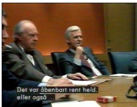
FDV's tilladte VHS-udgave